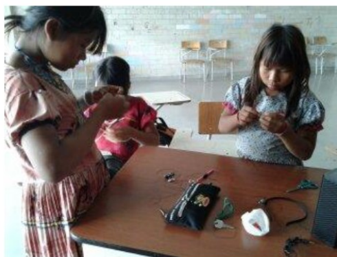
Ilustración 6. Trabajo colaborativo