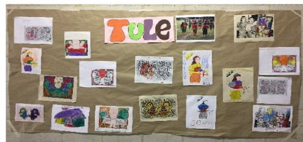
Ilustración 3. "Comunidades y pueblos indígenas"