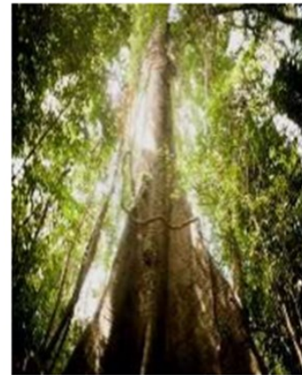
Á R B O L J E N E N É

Ina karagabi dai akore mauba dai eberama waufta nau druade. Mauba joma jai dizidau y kirinzia, ichi na kubunubu. Chi mukirara waufta, ichi Humantahú) i chi gedeko, kakaya, nau drua ma eberama deafeda chi be ina geea utu drua ina jarazia chi composición, chi juazidau ina karenibayua ina joma nejar monde. Diazidau joma chi tru, bukufeda ina leyes ina zobia, nau ebera drua ma ina bania nea nibafeda. Mau eberaba juridau ina bakuru jenene: nabu bedea jaranubua chi zama bena eberara bania unufeda