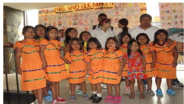
Ilustración 4. Grupo de danza Ebera. 2019